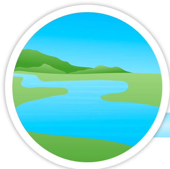
POBIERANIE WODY Z RZEK: OŁAWA I NYSA KŁODZKA

W SPECJALNYCH ZBIORNIKACH DROBNE, WIDOCZNE ZANIECZYSZCZENIA SKLEJANE SĄ W WIĘKSZE CZĄSTKI, KTÓRE OPADAJĄ NA DNO, ABY MOGŁY BYĆ USUNIĘTE