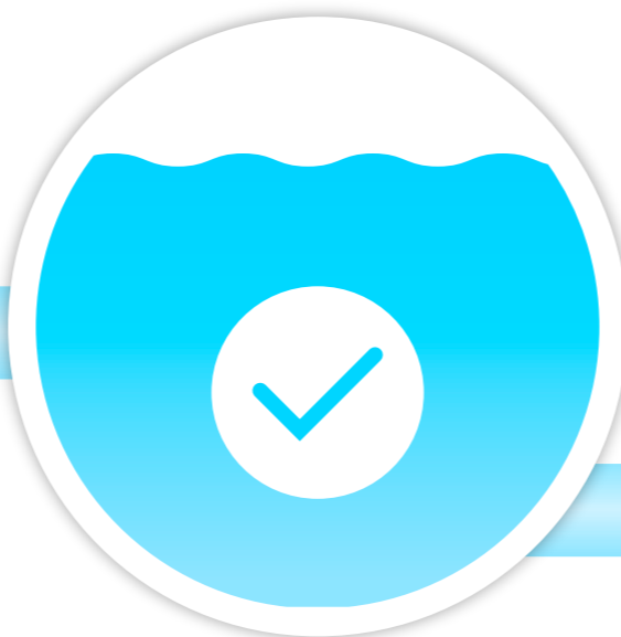
CZYSTA I ZDATNA DO PICIA WODA JEST POMPOWANA DO SIECI WODOCIĄGOWEJ